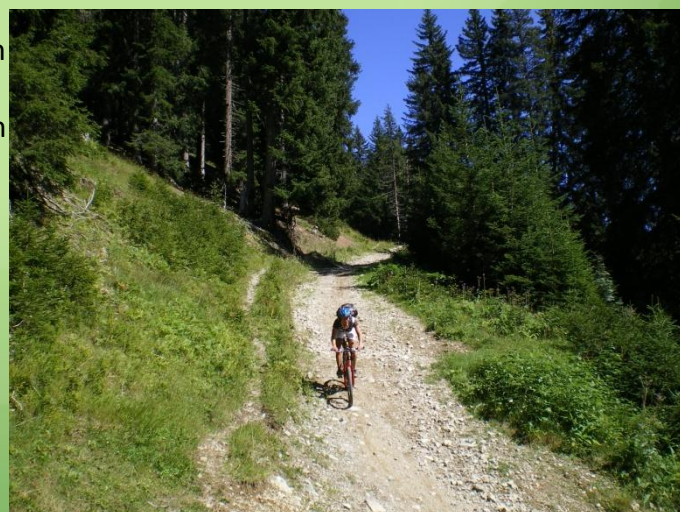
Silvia bei der Abfahrt nach Klosters Dorf